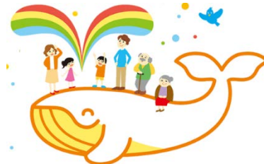
(公社)成年後見センター・リーガルサポート キャラクター「エールくん」